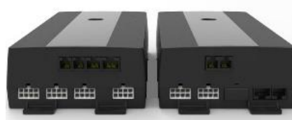
Centralina SCT4 iSMPS- 124.46000 Centralina SCT2 iSMPS- 124.26000